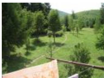
Pogled sa terase